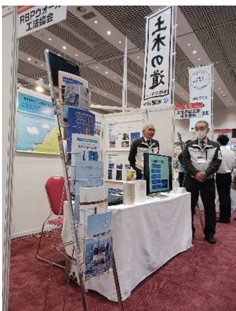
九州建設技術フォーラム 10/8,9 福岡国際会議場