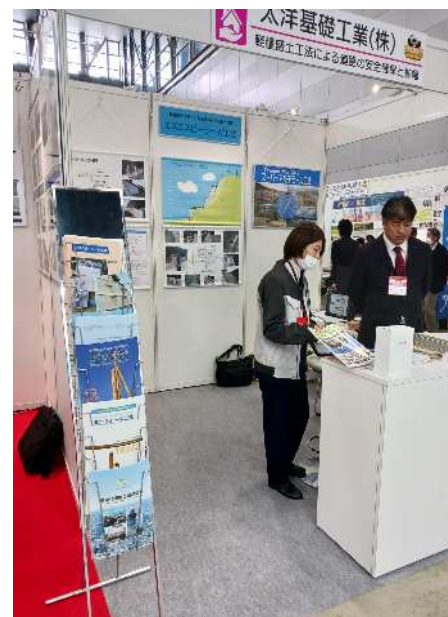
先進建設・防災・減災技術フェア in熊本 11/20,21 グランメッセ熊本