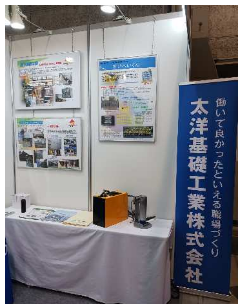
建設技術展2024近畿 11/7,8 インテックス大阪