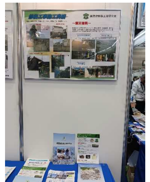
建設技術フェア2024n中部 11/28,29 ポートメッセなごや